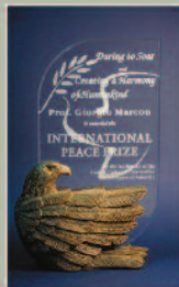
Διεθνές Βραβείο Ειρήνης